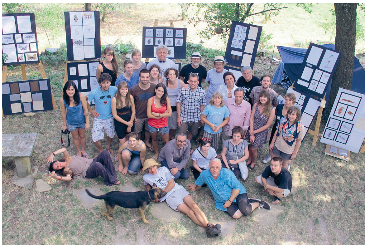
Udeleženci letošnje, že 16. delavnice Kaverljag