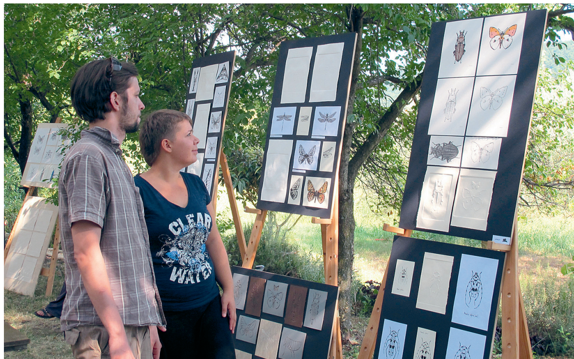
Čas za razstavo v naravi